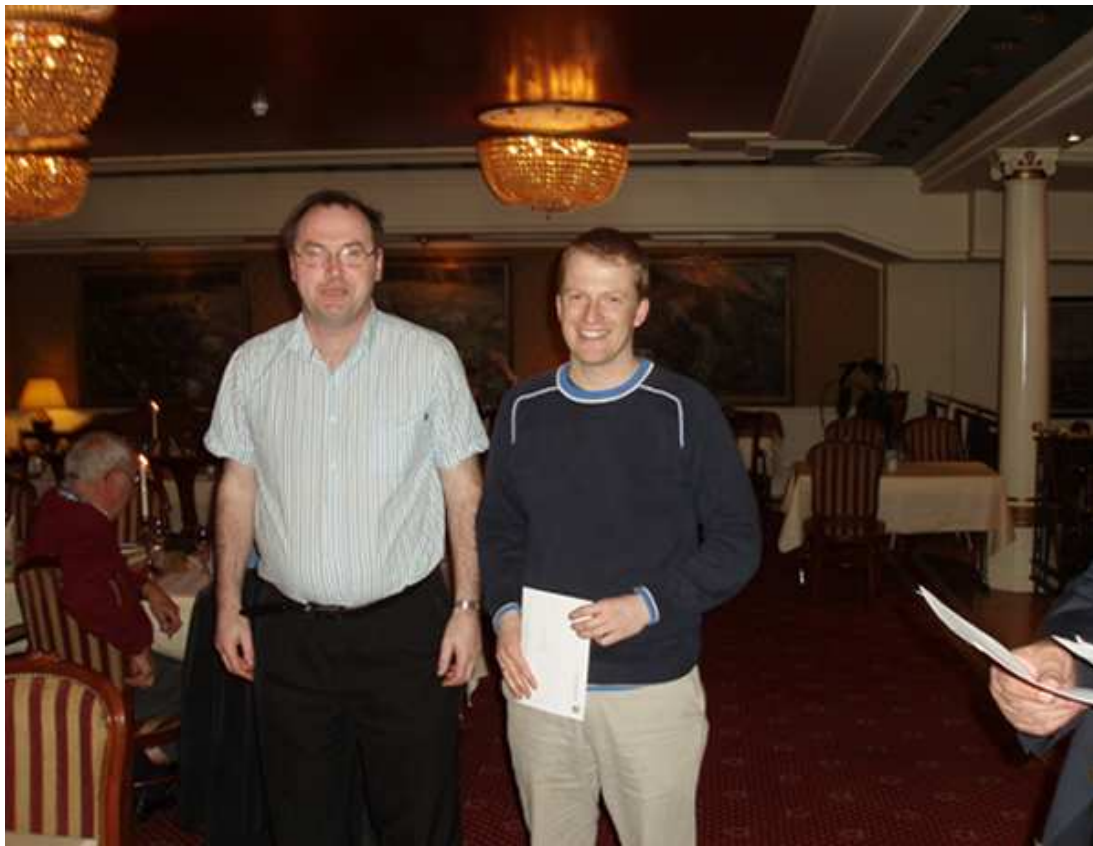
Eller på tredje plass!