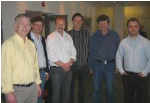
BAK 1 var suverene vinnere på Steinkjer

Slike arrangement er med og øker samholdet i en liten klubb. Jeg er sikker på at vi vil se større oppmøte og større iver etter å satse litt mer på bridgen etter dette. Når i tillegg spillere og forbund er fornøyde med det vi har gjort har vi fått "belønning" for innsatsen. Derfor er det ikke vanskelig på noen måte å starte på en ny sesong.