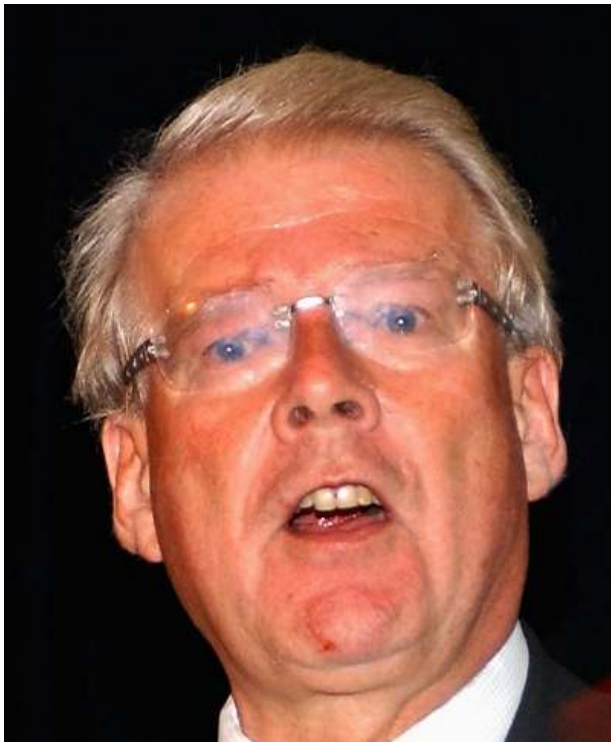
Carl I. Hagen – fremskritt med skvis og finesse !