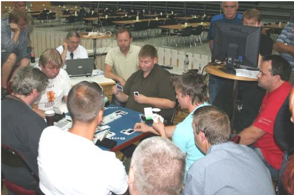
Sånn ser det ofte ut på Bord 1 i Nm par i Norge...