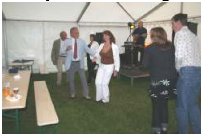
Folk kastet seg i dansen med en gang