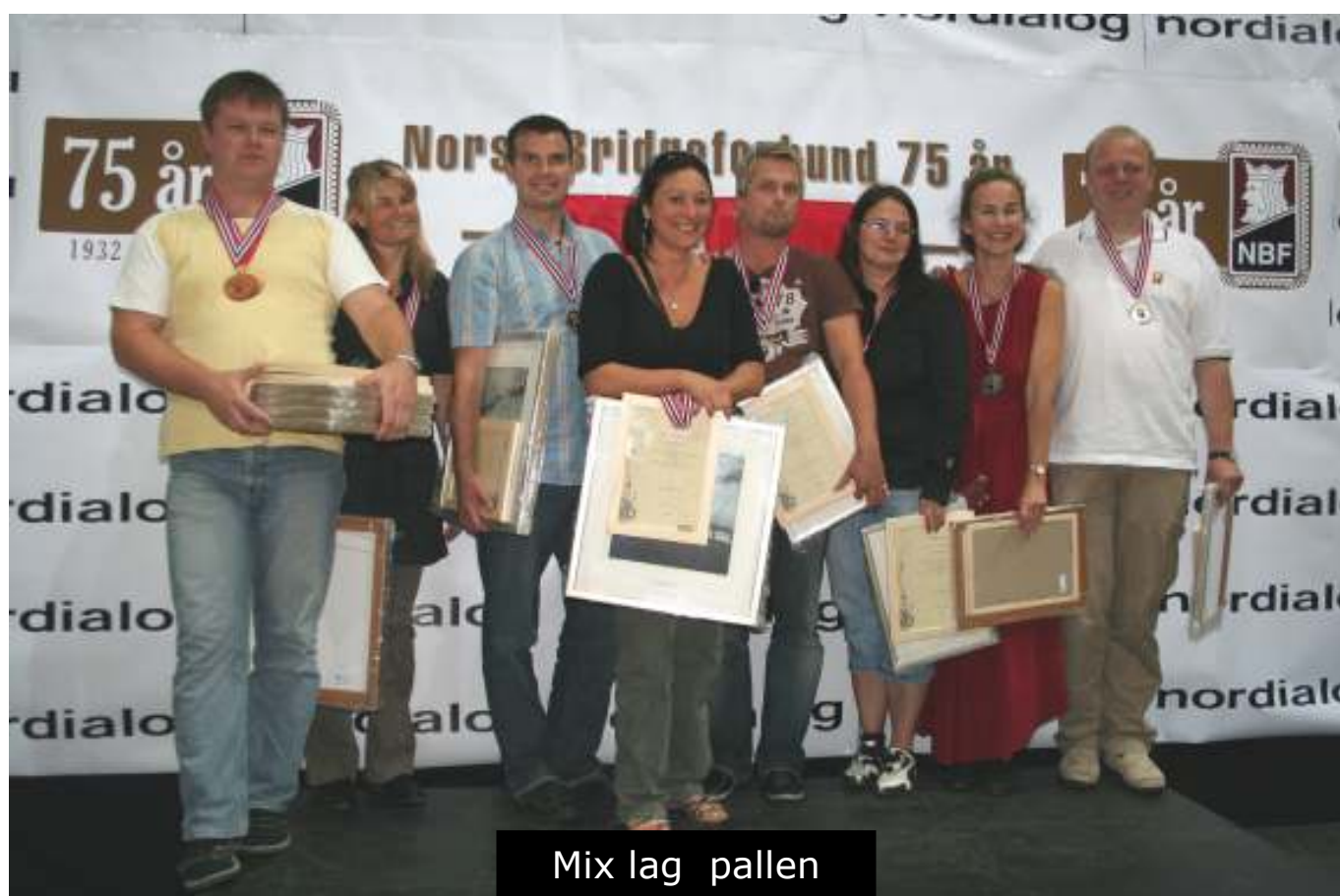
Mix lag pallen