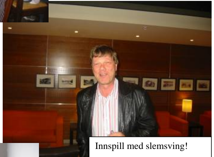
Innspill med slemsving!