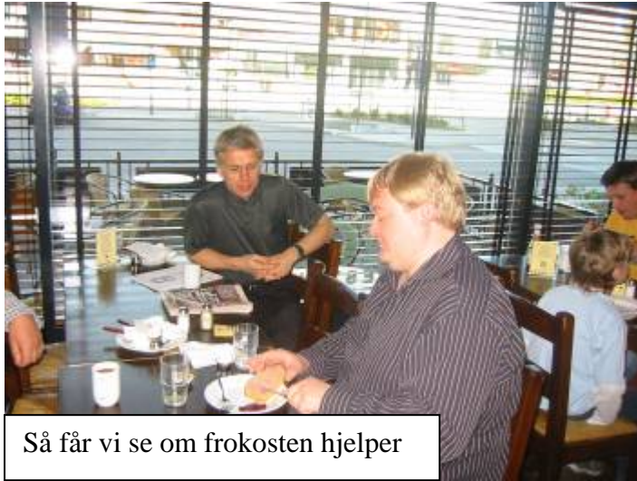
Så får vi se om frokosten hjelper