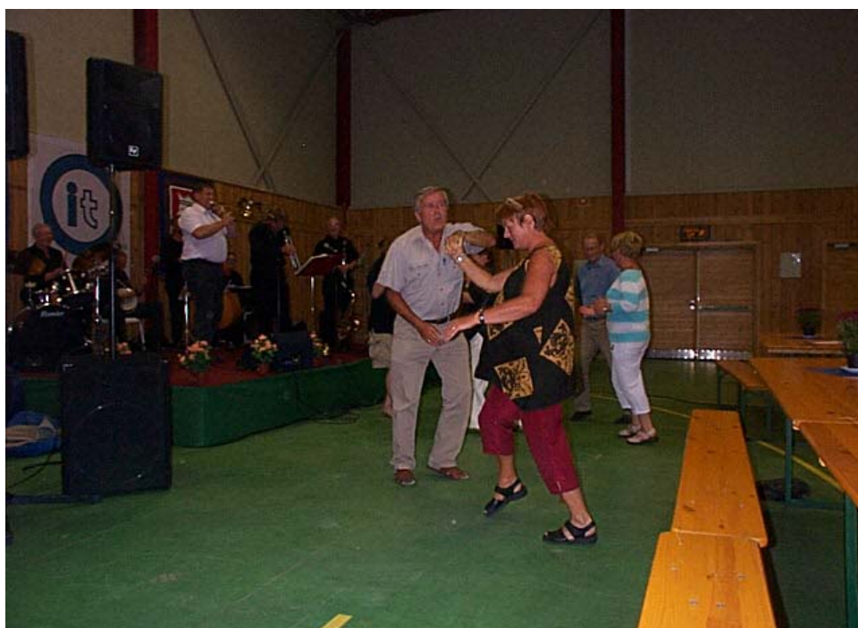
FLOTT STIL: Stilen er det ingenting å si nå.