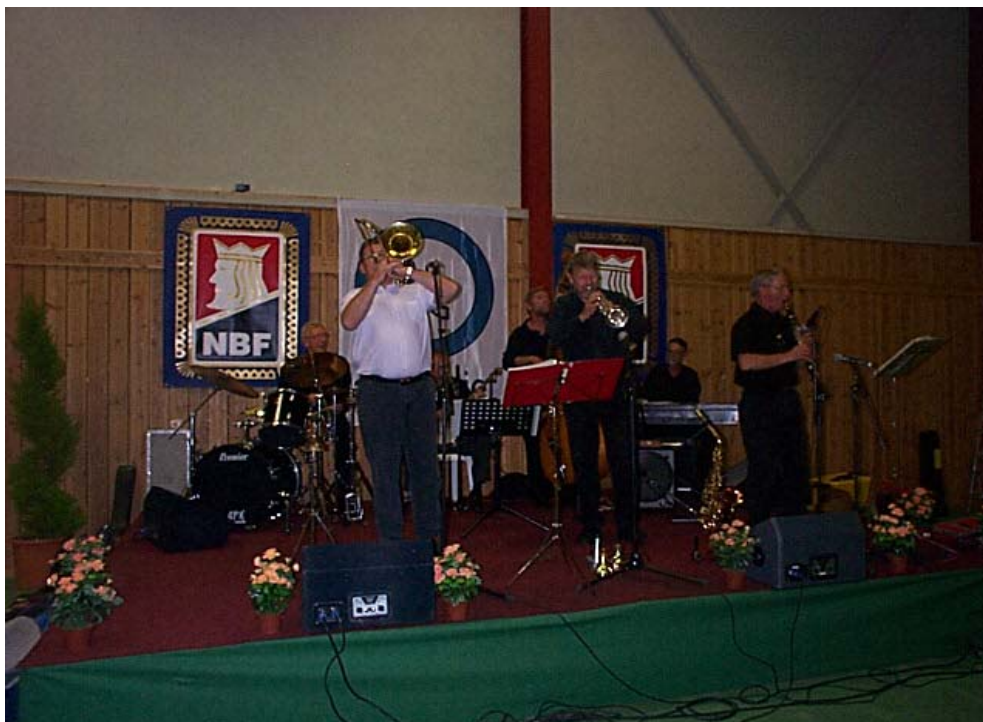
HOLDT TRØKKET: Bratsberg Amt Jazzorkester.