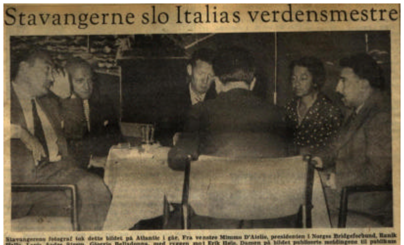
Fra oppgjøret den 22. August 1960 i Stavanger.

Q 9 Q 10 7 6 3 2 K 10 7 6 6 A K 10 8 6 4 2 E 8 ? K J 9 4 5 2 ? S? A Q 9 10 9 8 2 ? A K Q 7 J 7 5 3 5 J 8 4 3 K 5 4 3