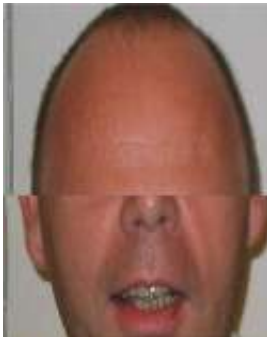
Torsken har tidligere bedt om å få være anonym. Det respekterer vi selvsagt.

Må også nevne Zia Mahmood, som jeg bare har spilt med to-tre ganger, men det har vært like fantastisk hver gang. Ikke fordi han er så mye bedre enn andre toppspillere, eller fordi resultatene våre har vært gode, men han er en utrolig karakter og har vært mitt forbilde helt siden jeg begynte med bridge.