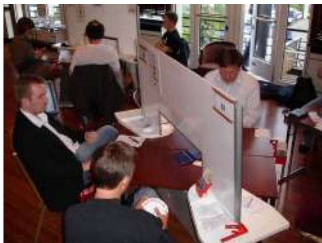
Heimdal var rett og slett best !!!