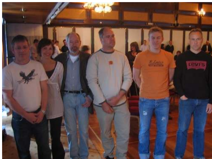
Flekkefjord har både imponert og kanskje overrasket..