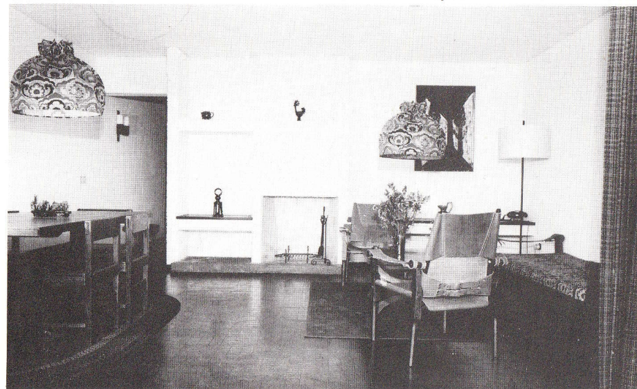
Fra stuen i en av leilighetene.