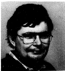
av Sverre Johnsen

Vi har de siste gangene sett på hvordan overføringsmeldinger kan brukes i noe uvanlige posisjoner. Det skal også denne utgaven av systemtips ta for seg. Først et par eksempler: