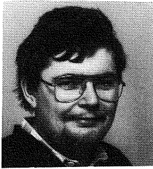
av Sverre Johnsen

Spalten tar gjerne imot spørsmål om systemvarianter. De som har allmenn interesse tas opp i bladet. Henvendelser sendes til NBF's kontor.