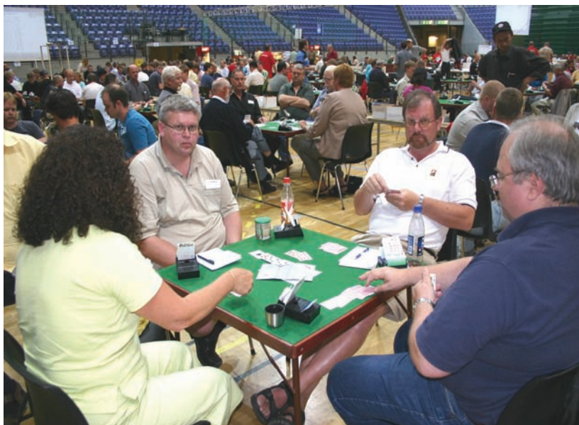
Under mottakelsen blir det tale v/presidenten, men da uten kort