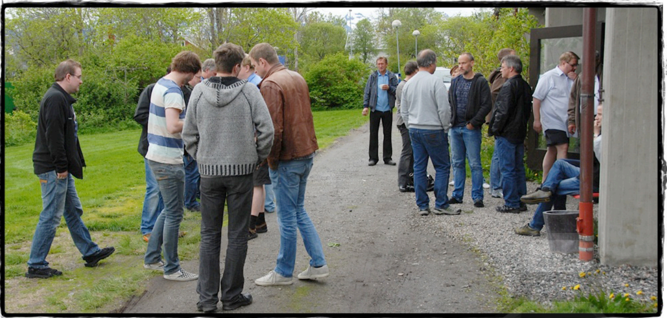
Pausene ble selvfølgelig brukt til å diskutere spill.