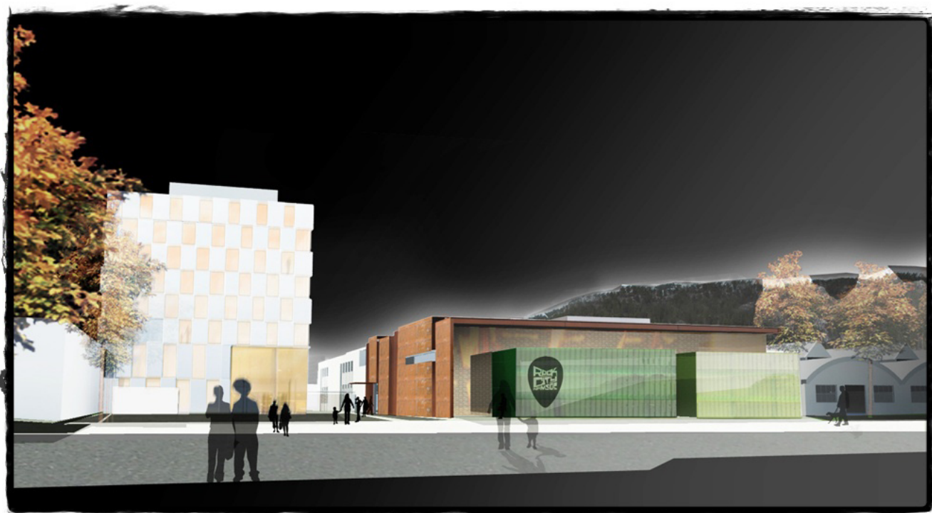
Namsos Rica Hotell