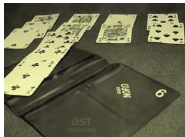
Blindemann i en håpløs kontrakt