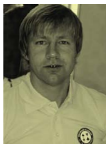
Gaute var spillende Hotelldirektør!