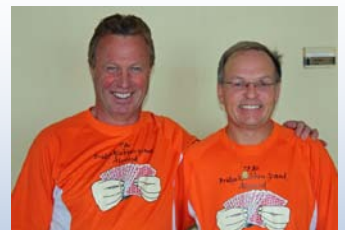
BK Grand er klar for NM finale arrangementet.