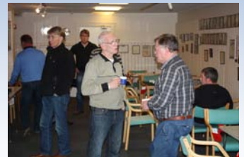
Stemmingsbilde fra BK Grand sin spillekveld mandag denne uken.