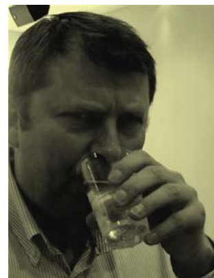
Brentebraut'n var den dominerende spilleren når det gjaldt antall spill i bulletinen, men medaljen glapp på oppløpssiden