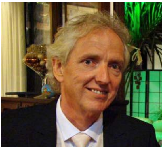
av GeO Tislevoll, Auckland, New Zealand

Årets NM for klubblag skal nå avsluttes med finale - ja, jeg kaller det fortsatt lagfinalen. Det ser åpent ut. Alle finalistene har bra sjanser, men noen av lagene peker seg likevel ut som større gull-favoritter enn de andre.