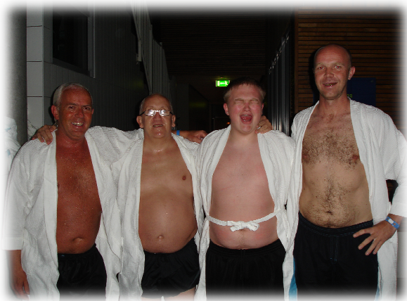
Noen av sjarmørene fra spa-bridge!

Dette blir selve manndomsprøven, særlig for de lagene med bare fire spillere. En svært interessant kamp mellom Studentene og Narvik 5 runde som vi fort får se i rama. Her er det bare å ståsette seg.