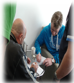
Ivrige Grandspillere etter 1 halvrunder