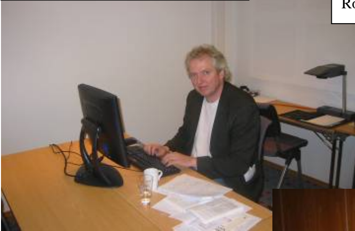
Ensom journalist i presserommeet