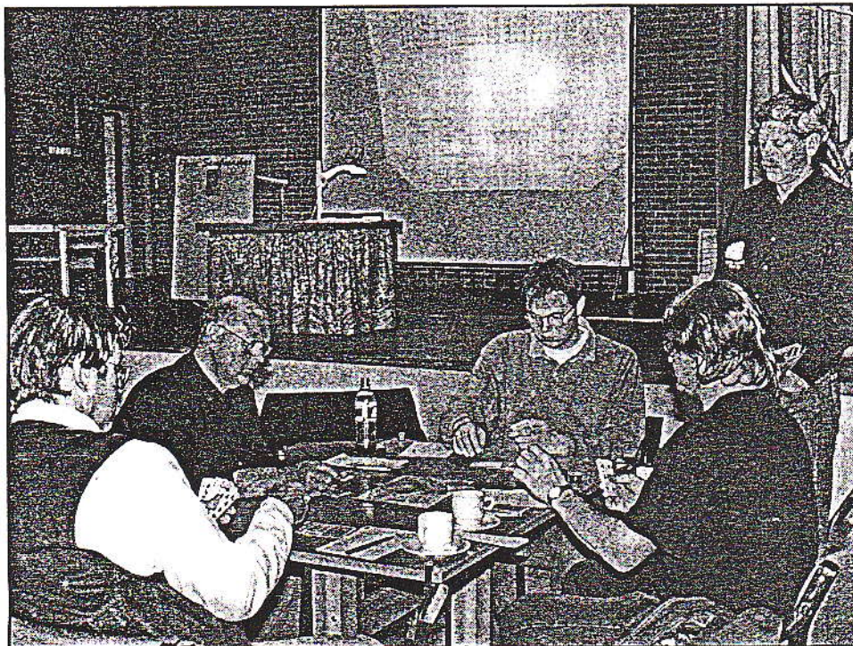
Konsentrasjon på topp under NM i bridge for klubb lag.