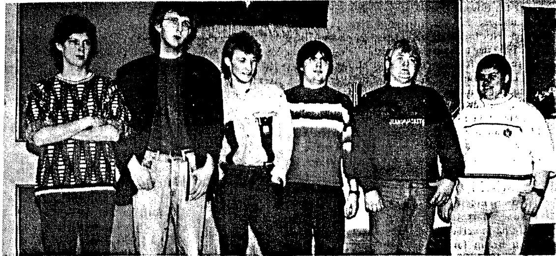
Landslaget som skal til Nordisk Mesterskap i Finland.