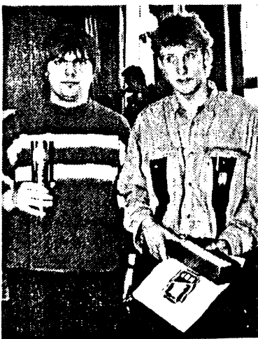
Skoglund/Molberg ble årets norgesmestre for juniorer i fjor.