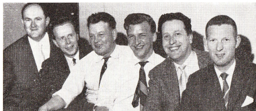
DE TRE SISTE ÅRSPARMESTRE!