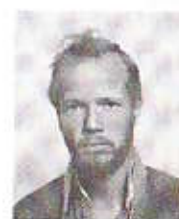
De glade vinnere.