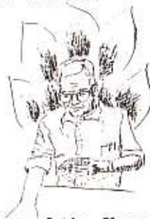
The keeper of the flame.

Presidenten var allerede i ferd med å pakke ned meldekortene, da det kom høyt og tydelig fra Oraklet: "Et øyeblikk, er det ikke min tur?"