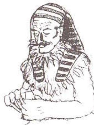
Sfinxen gjorde sitt aller beste for å se uberørt ut

"Puttski?" sa Oraklet og satte to uskyldsblå øyne på Sfinxen, mens han spilte en hjertes.