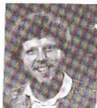
Av Paul Bang

At det gjøres feil i bridge, er en selvfølgelighet på hvilket som helst nivå, og det er et allment kjent fenomen at den spilleren eller det parat-/laget som gjør minst feil i løpet av en turnering, vil vinne. Dette er etter mitt syn likevel en grov forenkling. Det er nemlig slik at det ikke bare er snakk om feil i et kvantitativt perspektiv, men det er også snakk om hvilke situasjoner som får den enkelte til å gjøre feil. Med andre